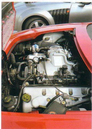
SVR-Motor / 4.600 ccm.