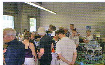
Beim Besuch der JU-Air Werkstatt.